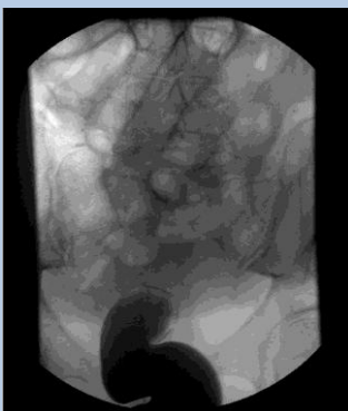
Tumorstenose Enddarm mit Ileus